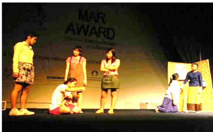
ภาพที่ 3 กิจกรรมการแสดงละครสะท้อนสังคม

การแสดงละครมีความสัมพันธ์กับวิถีชีวิตของผู้คนมาโดยตลอด และเราจะสามารถมองเห็นความสัมพันธ์ของละครกับชีวิตของผู้คนในสังคม เพราะละครจะถูกใช้ป็นเครื่องมือในการศึกษาหาความรู้เกี่ยวกับชีวิตของผู้คนในสังคมตามแต่จินตนาการของตนเอง ซึ่งผู้สร้างสรรค์บทละครมักจะนำเรื่องของการต่อสู้ดิ้นรนของมนุษย์ที่จะบังคับชีวิตให้เป็นไปตามจินตนาการของตนเองมาสร้างสรรค์เป็นบทละครอยู่เสมอ หรือ พยายามแสดงให้เห็นถึงความพยายามของตัวละครที่จะทำให้ชีวิตตนเองประสบความสำเร็จ นอกจากนี้แล้วผู้ชมละครยังสามารถเกิดการเรียนรู้ที่จะเข้าใจเกี่ยวกับชีวิตมากขึ้นจากการชมละคร และบางครั้งสามารถนำเอาบทเรียนที่ได้จากการชมละครมาแก้ไขปัญหาชีวิตให้คลี่คลายลงไปได้ด้วยเช่นกัน แสดงให้เห็นว่าละครสะท้อนสังคมและมนุษย์เกิดการเรียนรู้จากละคร