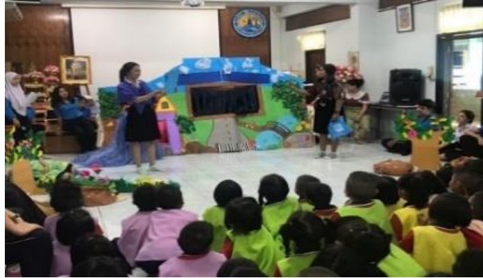
ภาพที่ 2 กิจกรรมละครและการเล่าเรื่องสำหรับเด็กปฐมวัย

การแสดงละครมีความสัมพันธ์กับวิถีชีวิตของผู้คนมาโดยตลอด และเราจะสามารถมองเห็นความสัมพันธ์ของละครกับชีวิตของผู้คนในสังคม เพราะละครจะถูกใช้ป็นเครื่องมือในการศึกษาหาความรู้เกี่ยวกับชีวิตของผู้คนในสังคมตามแต่จินตนาการของตนเอง ซึ่งผู้สร้างสรรค์บทละครมักจะนำเรื่องของการต่อสู้ดิ้นรนของมนุษย์ที่จะบังคับชีวิตให้เป็นไปตามจินตนาการของตนเองมาสร้างสรรค์เป็นบทละครอยู่เสมอ หรือ พยายามแสดงให้เห็นถึงความพยายามของตัวละครที่จะทำให้ชีวิตตนเองประสบความสำเร็จ นอกจากนี้แล้วผู้ชมละครยังสามารถเกิดการเรียนรู้ที่จะเข้าใจเกี่ยวกับชีวิตมากขึ้นจากการชมละคร และบางครั้งสามารถนำเอาบทเรียนที่ได้จากการชมละครมาแก้ไขปัญหาชีวิตให้คลี่คลายลงไปได้ด้วยเช่นกัน แสดงให้เห็นว่าละครสะท้อนสังคมและมนุษย์เกิดการเรียนรู้จากละคร